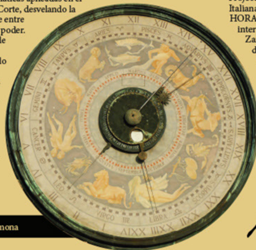
Reloj del Torrazzo - Cremona

Los veintidós libros de los ingenios y de las máquinas - Manuscrito Biblioteca Nacional de España, MSS/3372