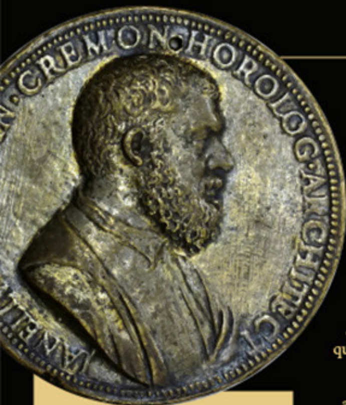
Juanelo Turriano - Medalla (Musei Civici Ala Ponzone - Cremona)

creaciones mecánicas, llamándolo "segundo Arquímedes" y "nuevo Dédalo". Si en el caso de Brunelleschi se dice que sus obras, sobre todo la gran cúpula florentina, hablan por él, con Juanelo sucede lo contrario: el paso del tiempo ha conllevado la desaparición de sus más relevantes creaciones, dejando, sin embargo, tanto en la memoria colectiva de su patria –el ducado de Milán– como de su tierra adoptiva –España– un recuerdo vivo, en ocasiones teñido de los colores engañosos del mito.