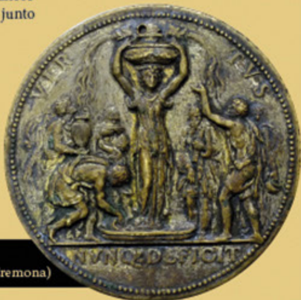
Alegoría con la Fuente de las Ciencias Medalla (Musei Civici Ala Ponzone - Cremona)

La muestra reúne fondos bibliográficos de la Biblioteca Nacional de España junto con obras de arte y material bibliográfico y documental de distintas instituciones cremonesas, así como material gráfico de la Fundación Juanelo Turriano y un soberbio busto de Turriano en mármol del taller de los Leoni (Museo de Santa Cruz), recién restaurado por el Instituto del Patrimonio Cultural de España (IPCE).